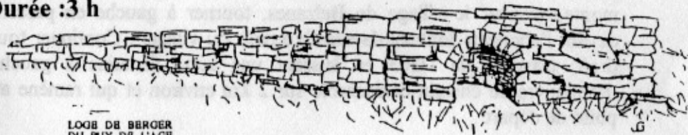
LOGE DE BERGER DU PUY DE L'AGE

Balisage : rose n°3 Longueur : 10 km Durée : 3 h