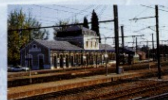
La gare SNCF.