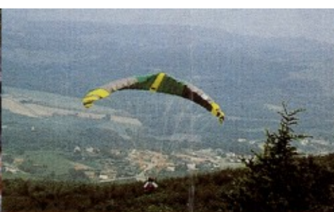
Piste d'envol de deltaplanes.