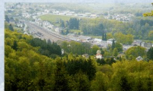
Vue panoramique de la gare de Saint-Sulpice-Laurière.

Les circuits de Saint-Sulpice-Laurière sont reliés et peuvent offrir aux amateurs une grande boucle de randonnée à faire en une ou plusieurs journées.