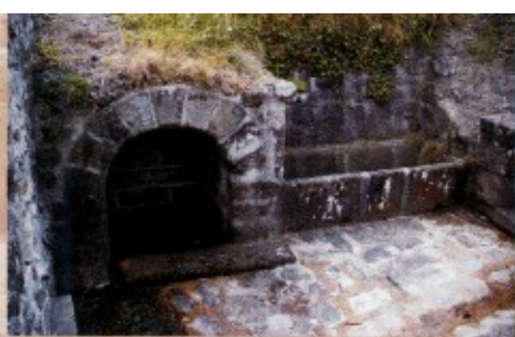
Fontaine abreuvoir de Cressac.