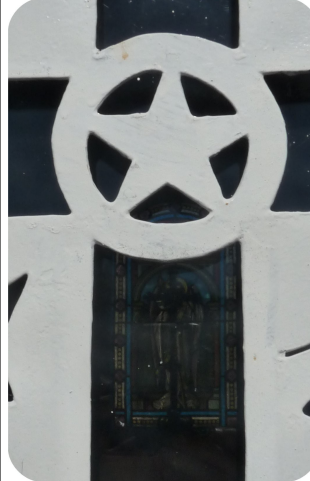
Grille d'une chapelle funéraire dans l'allée B (une autre dans l'allée principale était blanche)