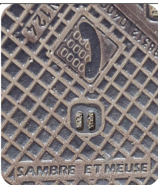
Plaque au sol pour caniveau câbles téléphoniques