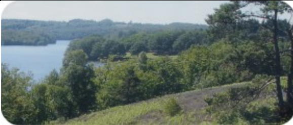
Panneau d'information Haute-Vienne sur la place des Fossés