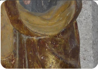
EGLISE : Statue à gauche de l'autel (Ste Anne, la Vierge et l'Enfant Jésus)