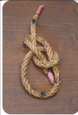
Imposte porte en face de l'église