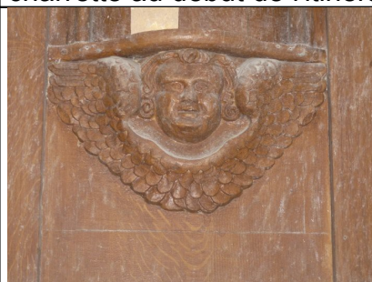
EGLISE : Figure sur le retable à gauche