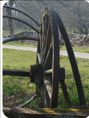
Vieilles roues de charrette au début de l'itinéraire à Leycuras