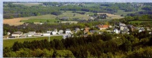
Vue panoramique depuis la Pierre du Roy.

À l'angle sud des antennes, le chemin traverse une lande de bruyères et de fougères en longeant la forêt. Descendre sur 300 m puis prendre à droite. Vue sur le carrefour du col de la Roche. Descendre par un chemin, parfois humide, qui rejoint la route au col de la Roche (456 m). Traverser la D 914 en direction de Saint-Sulpice-Laurière. Les promeneurs fatigués peuvent rejoindre directement leur point de départ en traversant Saint-Sulpice-Laurière. Pour les plus courageux, il reste encore une belle promenade à travers la forêt. Prendre à gauche en direction du Maillorat. La route monte sur 200 m environ. Prendre le chemin forestier sur la droite et suivre sur 800 m jusqu'à un virage goudronné très accentué. Dans le virage, prendre à droite un chemin qui traverse la forêt sur 1,5 km environ et rejoint Saint-Sulpice-Laurière au lieu-dit «La Pissarote» à cause des nombreuses sources qui s'y rejoignent. Vous êtes alors à 25 m de votre point de départ : le lavoir de Cressac.