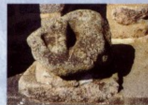
Pierre de saint Sulpice