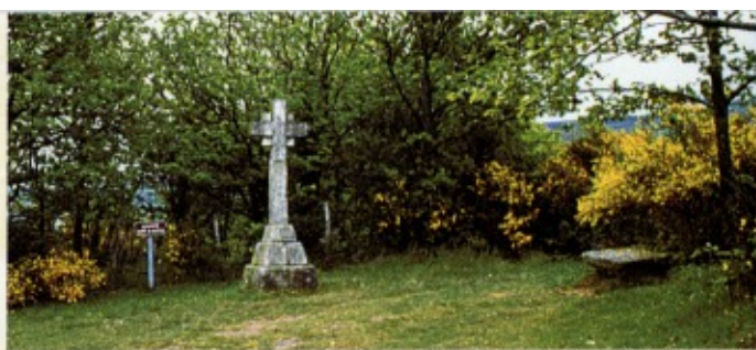
La Croix du Tilleul.