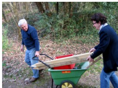
Cette photo vous montre le travail des bénévoles !

Vous arrivez à un carrefour important : heureusement de magnifiques pancartes, installées par Nature et Patrimoine, vous permettent de prendre la bonne direction.